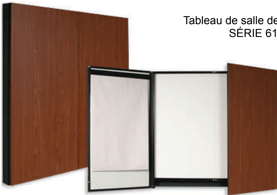
Tableau de salle de conférence SÉRIE 618C

Équipez votre salle de conférence d'un de nos tableaux de la série 618C.